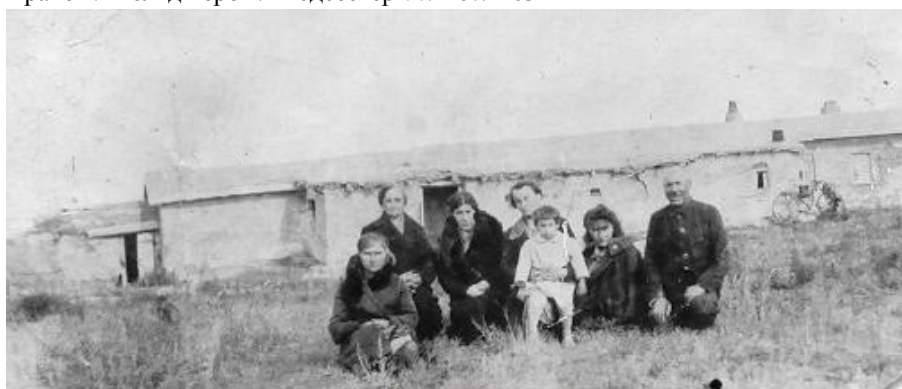
Outside Martuk railway station

Врачей / Фельдшеров / Медсестер 77/ 107/ 163